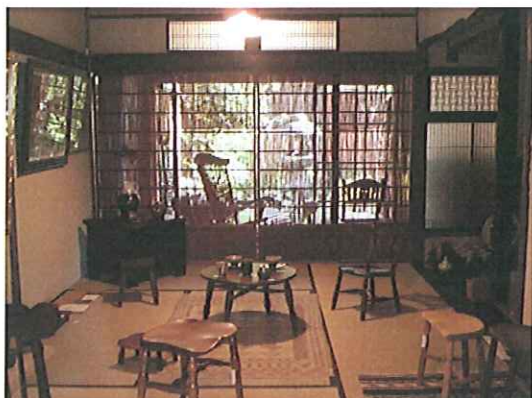
↑前回開催の手造り本物展の様子。椅子・木工・陶芸